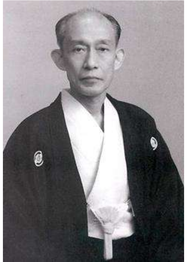
合気道二代道主 植芝吉祥丸 先生