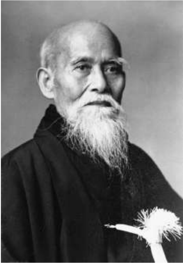
合気道開祖 植芝盛平 翁